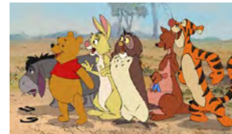
Nalle Puhin elokuvan (2011, USA) ovat ohjanneet Stephen J. Anderson & Don Hall

UUDET SEJKKAILUT PUOLEN HEHTAARIN METSÄSSÄ su 8.5. klo 13 Elokuvateatteri Studio Kesto: 69 min Ikäraja: S Vapaa pääsy (nouda lippusi Valveen lippu- myymälästä)