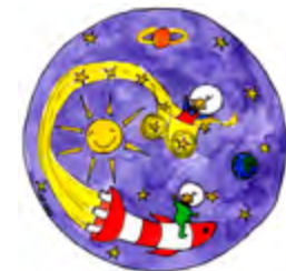
Kuva: Otavaisen olkapäillä

PÅ RYMDFÄRD I KARLAVAGEN RUNOLEIKKIHETKI 1–5-vuotiaiden lasten perheille la 16.4. klo 11 ja 12 Kesto: noin 40 min Valvenäyttämö, 2. krs. Liput 7 €, Valveen lippumyymälästä