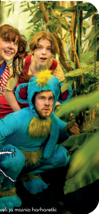
Pikkuveli ja mainio harharetki